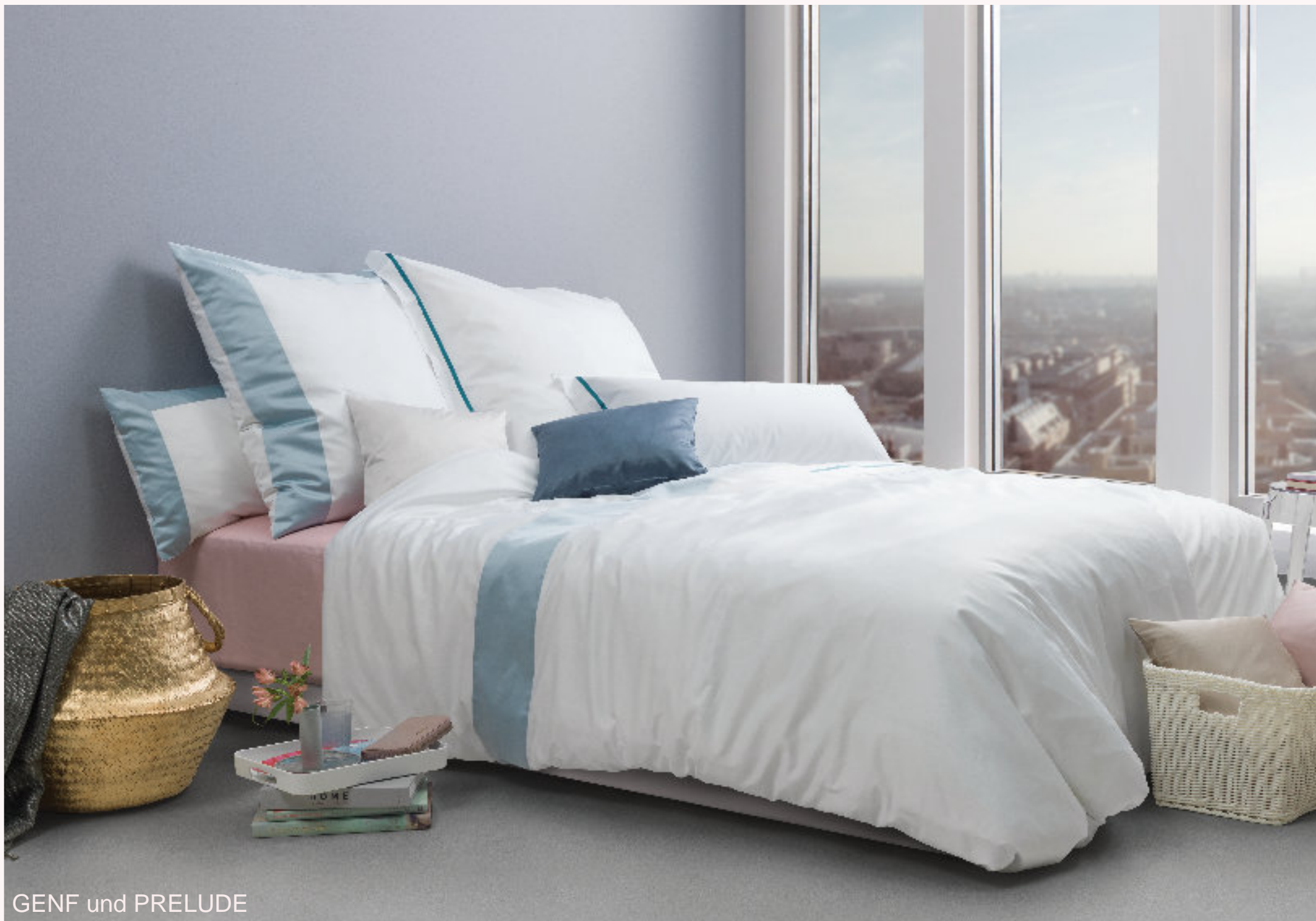
GENF und PRELUDE